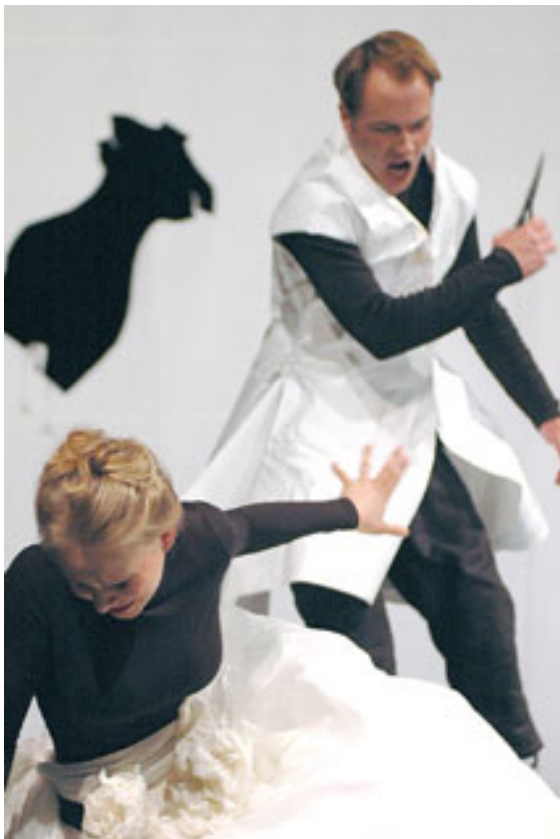
Bildunterschrift: Virtuoser Schnitt. die „Figaro“-Version des russischen Teams in Graz