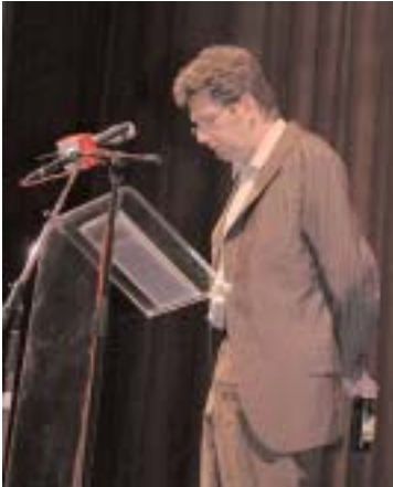
Franzobel spricht über "Konfekt und Kondome"