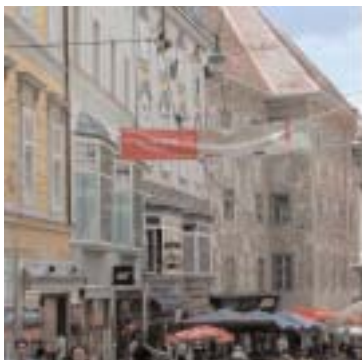
Straßenbanner in der Sporgasse

Ende Mai wurde das 24-seitige vierfarbige Programmheft, das den Programmablauf, Grußworte, Projektbeschreibungen uvm. enthielt, als Einladung an wichtige Persönlichkeiten der Kultur- und der Politzscene verschickt. Weiters wurde ein Mailing mit Finale-Flyer an die Intendanten aller Europäischer Opernhäuser gemacht.