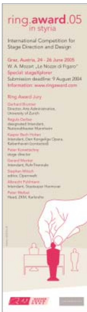
Inserat in Opera Magazin, April 2004

Wie in den Wettbewerben in den Jahren 2000 und 2003 sollte neben der „traditionellen“ Sparte auch beim Ring Award 05 wieder eine experimentelle Sparte am Puls der Zeit angeboten werden. Obwohl die Entwicklungszeit knapp war, fand das Organisationsteam zu einer aktuellen Fragestellung. Nach Cyberstaging und hoffmann.remixed fordert der stageXplorer die TeilnehmerInnen dazu auf, mittels spartenübergreifender Vernetzung neue Produktionsmethoden zu entwickeln und/oder die Werkintegrität aufzulösen, um Mozarts „Le nozze di Figaro“ zu einem neuen Ganzen zusammenzufügen.