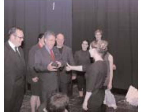
Bundespräsident Dr. Heinz Fischer begrüßt die Sänger des russischen Regieteam hinter der Bühne