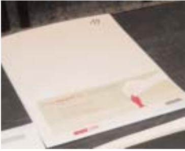
Mappe mit Einreichung und Bewertungbogen für die Ring Award-Jury