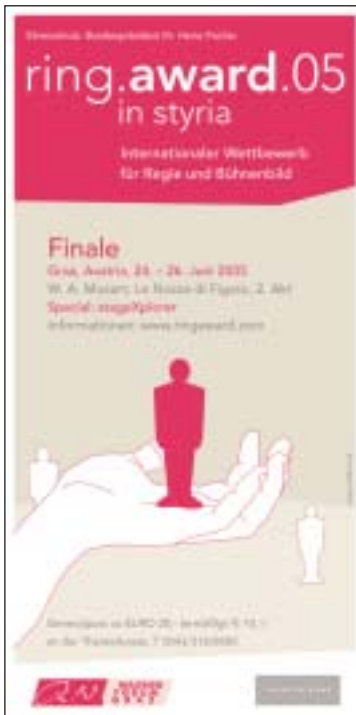
Flyer zum Finale 2005