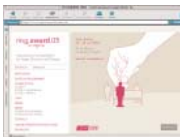
Internetauftritt: englische Startseite

Zusätzlich wurden alle ehemaligen TeilnehmerInnen per Mail vom neuen, vorgezogenen Wettbewerb informiert und zahlreiche Musiktheater-Institutionen gebeten, ihre Home Pages mit der Ring Award-Site zu verlinken.